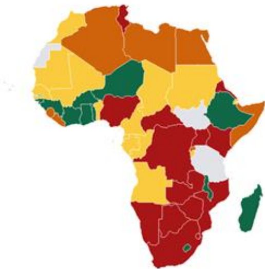
Figure 2: Carte des États membres de l'UA par niveau de points chauds sur le tableau de bord du PERC. Ce système est destiné à mettre en évidence les États membres de l'UA nécessitant une attention particulière en raison d'une épidémie croissante ou généralisée. Pour plus de détails sur les calculs, reportez-vous à la méthodologie du tableau de bord.

Le tableau ci-dessous met en évidence les changements dans les mesures sociales et de santé publique (MSSP) sur la base des données du suivi des réponses COVID-19 du Gouvernement d'Oxford . Une flèche vers le haut indique que de nouvelles MSSP ont été annoncées ; une flèche horizontale indique que les MSSP ont été étendues ; une flèche vers le bas indique que les MSSP ont été assouplies/expirées. Les États membres sont organisés par niveaux sur la base des données épidémiologiques actuelles du 24 au 30 mai.