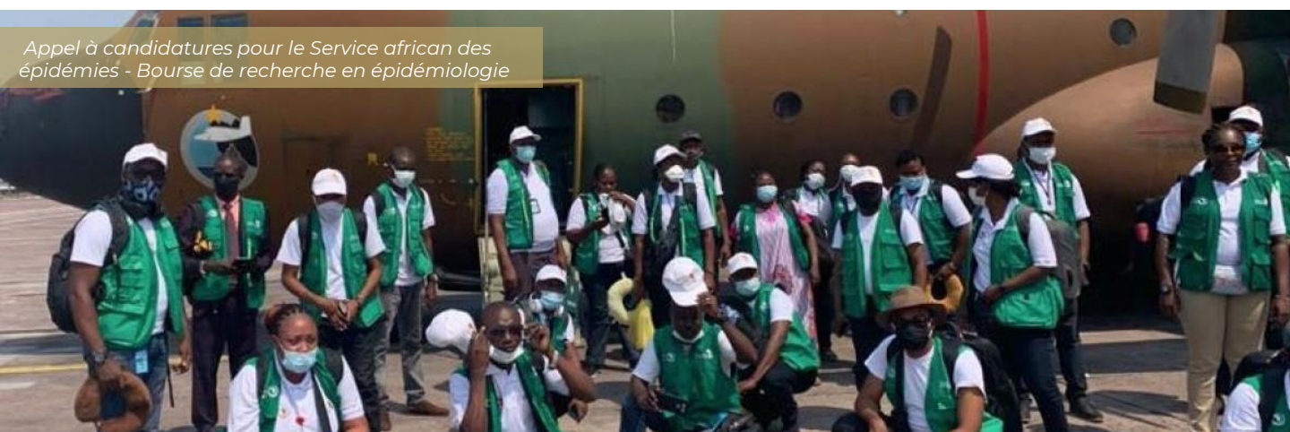
Appel à candidatures pour le Service africain des épidémies - Bourse de recherche en épidémiologie

Le CDC Afrique, en collaboration avec l'Union africaine, a lancé la bourse Épidémiologie Track. Ce programme vise à renforcer les programmes de formation en épidémiologie de terrain à travers l'Afrique. Cette initiative de formation de deux ans, axée sur les compétences, vise à améliorer la qualité de la formation et à augmenter le nombre d'épidémiologistes hautement qualifiés. Il vise également à combler le déficit de sécurité sanitaire du continent en s'efforçant de disposer d'un épidémiologiste qualifié pour 200 000 habitants. En savoir plus