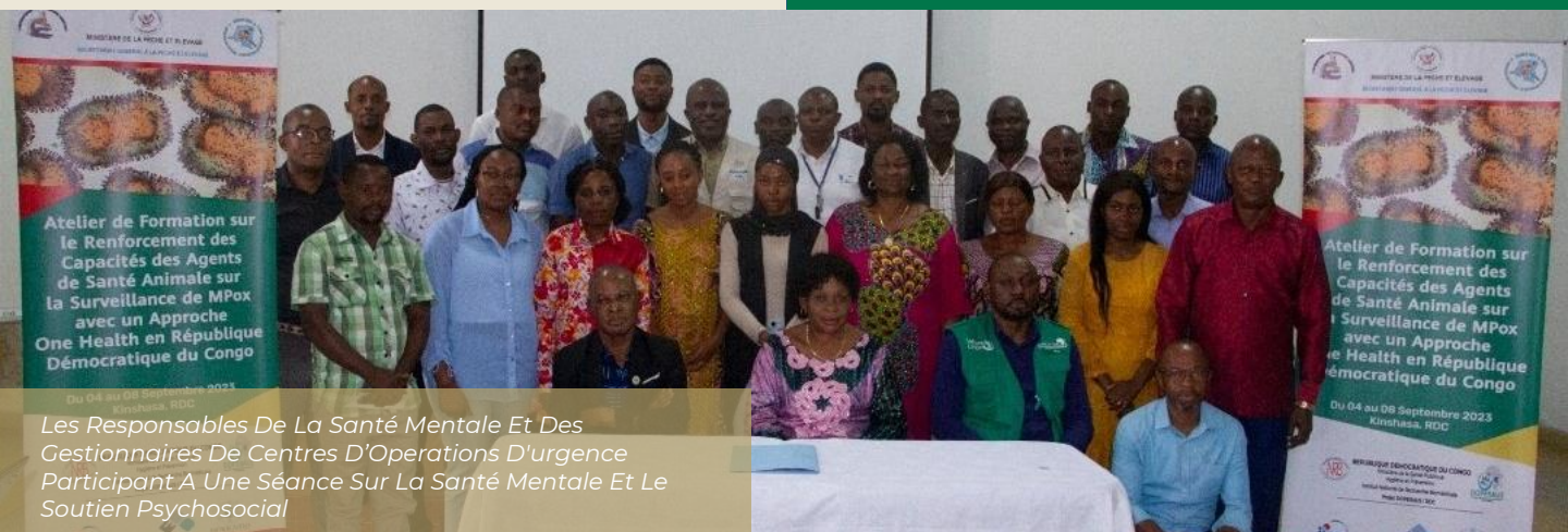
Les Responsables De La Santé Mentale Et Des Gestionnaires De Centres D'Operations D'urgence Participant A Une Séance Sur La Santé Mentale Et Le Soutien Psychosocial