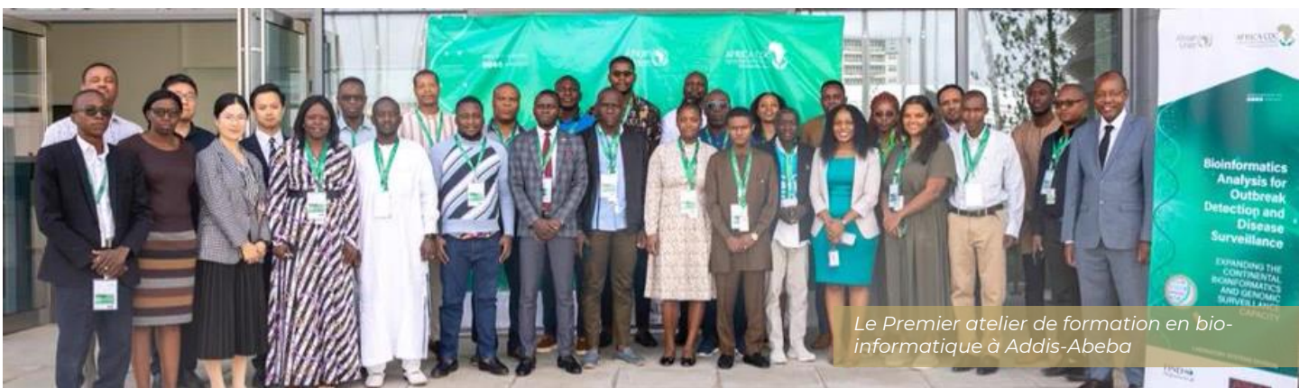
Le Premier atelier de formation en bio-informatique à Addis-Abeba