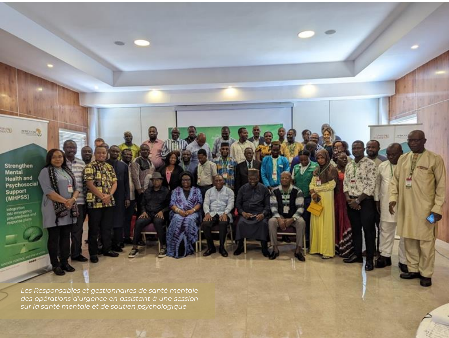
Les Responsables et gestionnaires de santé mentale des opérations d'urgence en assistant à une session sur la santé mentale et de soutien psychologique

Pour renforcer la résilience des communautés dans la région, le CDC Afrique a également facilité le partage des enseignements tirés des expériences vécues lors de la pandémie de COVID-19 et d'autres situations d'urgence. Cela comprend la création de réseaux régionaux et l'utilisation de l'ensemble de services minimum SMSPS pour concevoir et exécuter des initiatives dans les pays participants