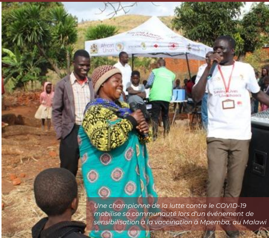
Une championne de la lutte contre le COVID-19 mobilise sa communauté lors d'un événement de sensibilisation à la vaccination à Mpemba, au Malawi

Grâce à une approche multiforme, la campagne est allée au-delà de la simple fourniture de vaccins. Il s'est penché sur des séances éducatives, abordant l'hésitation à la vaccination, dissipant les mythes et promouvant l'importance de la vaccination pour protéger les individus et les communautés contre le virus.