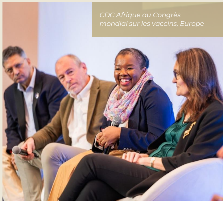
CDC Afrique au Congrès mondial sur les vaccins, Europe