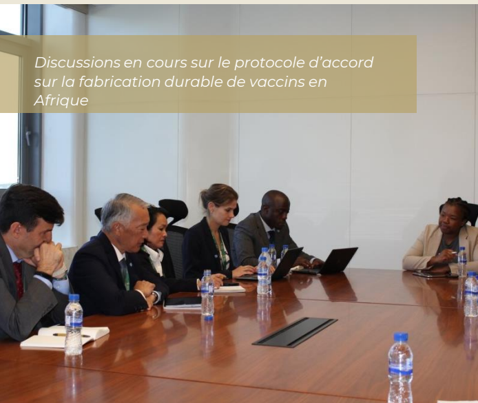
Discussions en cours sur le protocole d'accord sur la fabrication durable de vaccins en Afrique