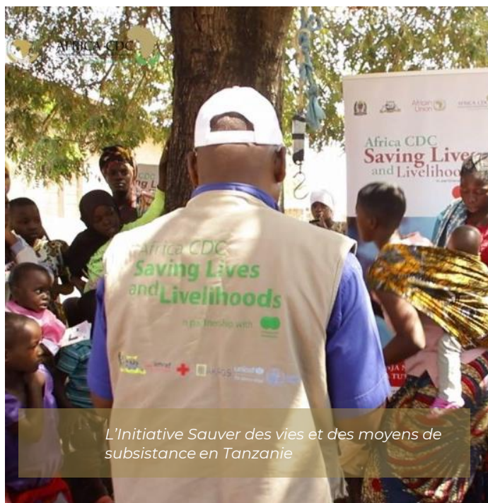
L'Initiative Sauver des vies et des moyens de subsistance en Tanzanie

Regardez un documentaire sur cette réalisation pour l'histoire complète .